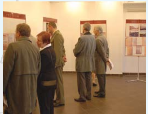
Wernisaż wystawy "Trzy miesiące samostanowienia - Śląsk Cieszyński od października 1918 roku do stycznia 1919"