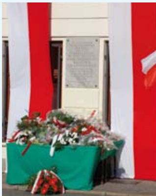
Kwiaty złożone pod tablicą upamiętniającą powstanie Rady