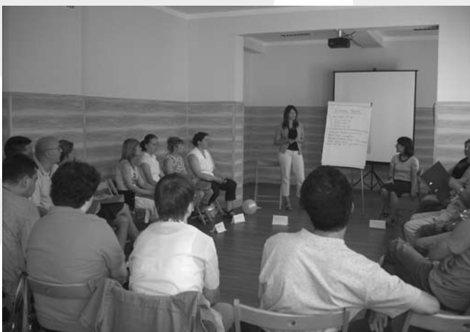
Jedno ze szkoleń

Fundacja Rozwoju Przedsiębiorczości Społecznej „Być Razem” realizuje od lipca projekt „Przedsiębiorstwo Socjalno-Edukacyjne w Cieszynie” w ramach Rządowego Programu – Fundusz Inicjatyw Obywatelskich.