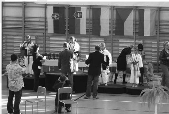
Wręczenie nagród podczas bielskich zawodów karate

Wszystkim zawodnikom Shindo serdecznie gratulujemy i życzymy kolejnych sukcesów sportowych!