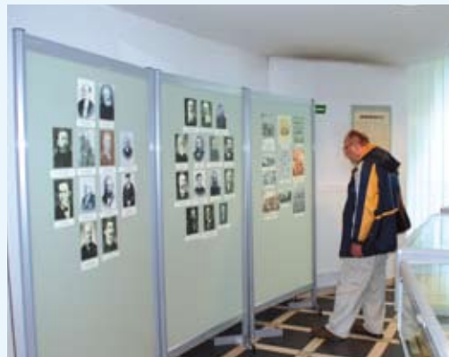
Wernisaż wystawy "W drodze do Ziemi Obiecanej. Cieszyńscy Polacy 1848 - 1918"