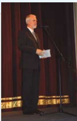
Wystąpienie Posła do Parlamentu Europejskiego Jana Olbrycha