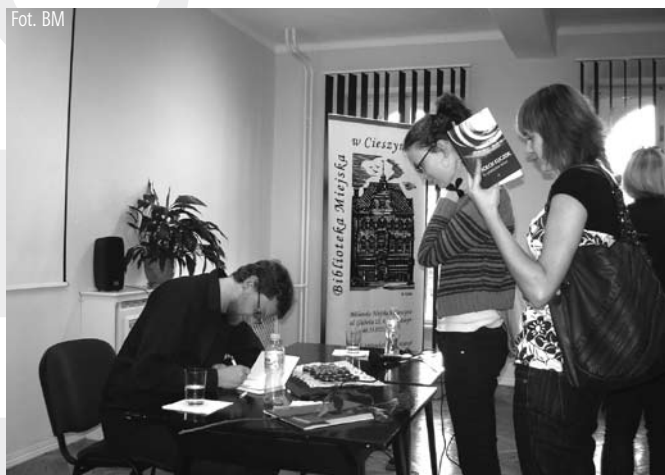
Wojciech Kuczok podpisuje swoje książki