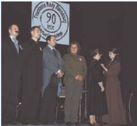
Odtworzenie fragmentu przebiegu pierwszego posiedzenia RNKC przez aktorów Sceny Polskiej z Czeskiego Cieszyna